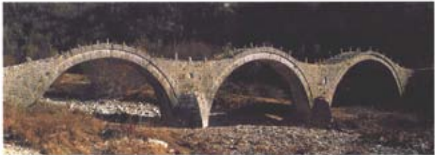
Башд Алма - Та "Кайкочкит" мисити / Kipi village - "Kainqerko" bridge