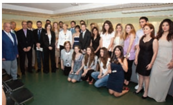
Τελετή απονομής των βραβείων. Μάιος 2010