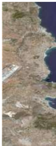
[A] Ανατολική Αττική