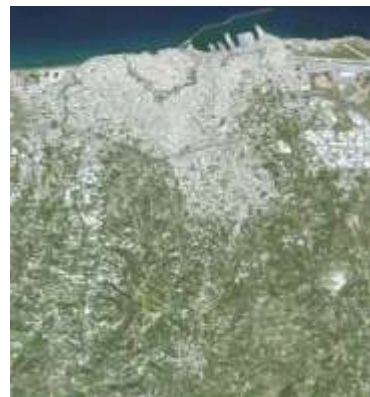
[B] Ηράκλειο Κρήτης